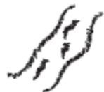
3 信濃川 信濃川 SHINANO RIVER

利用線條記錄你所聽到的水聲。 水の音を線で描いて表現してみましょう。 Show the sound of water by drawing lines.