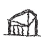
4 香港部屋平台 香港ハウステラス HONG KONG HOUSE TERRACE

你聽到這段聲音有什麼感受？利用三個詞語把感受記錄下來。 今お聴きの音に対してどのように感じられますか？簡潔にその気持ちを説明してみましょう。 How do you feel about what you are listening to? Try to use a few words to describe your feeling.