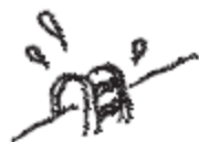
1 游泳池 水泳プール SWIMMING POOL

現在是什麼時間？天氣如何？游泳池令你印象最深刻的聲音是什麼？ 今は何時ですか？天気はどうですか？ 水泳プールで聞こえる音と声の中で、もっとも印象的だったのは何ですか？ What time is it now? How is the weather? What is the most remarkable thing you hear at the swimming pool?